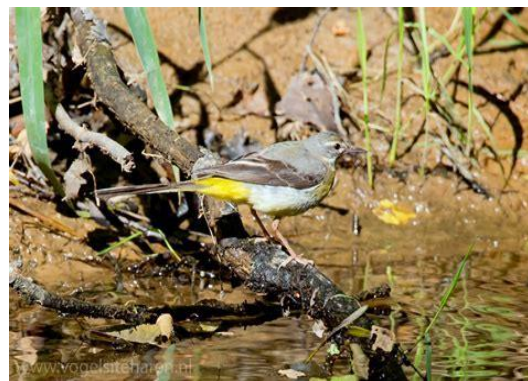
Grote gele kwikstaart