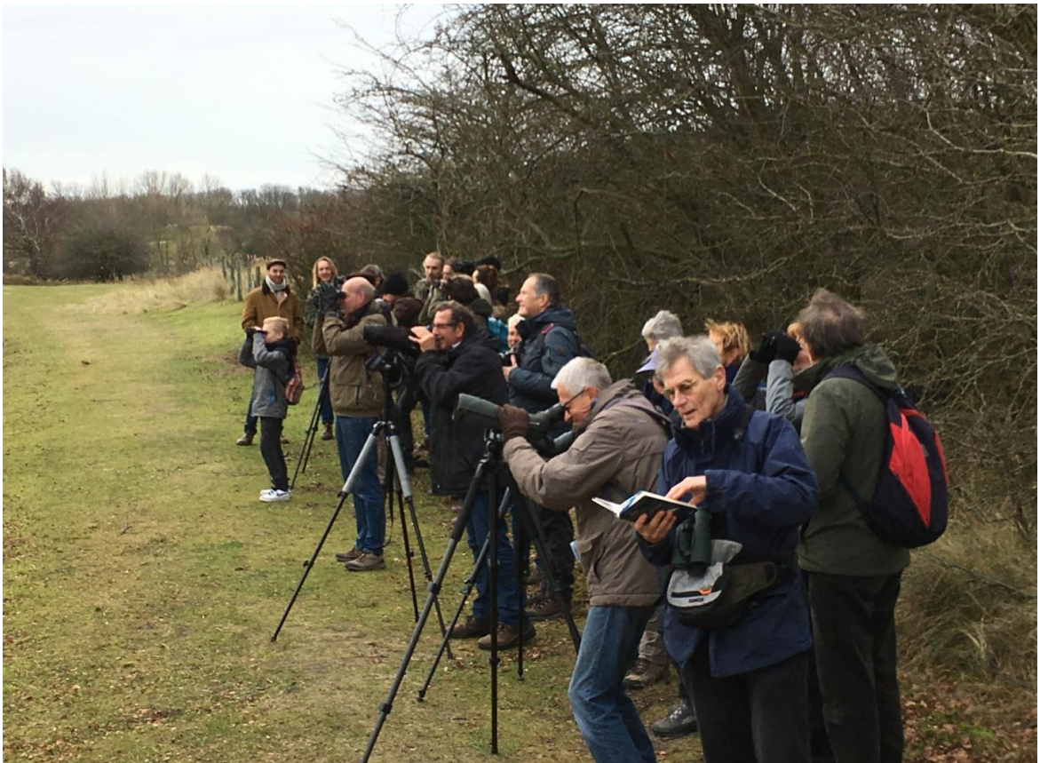
Determinatie van groep Grote en Kleine barsijs

Amsterdamse Waterleidingduinen WaterNet - Ingang Panneland