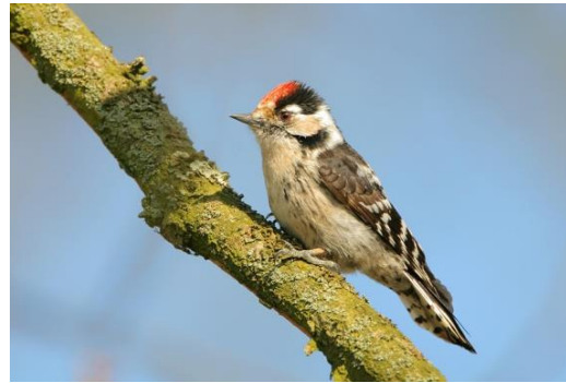
Kleine bonte specht