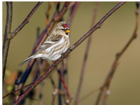
Grote barmsijs (Birdphoto.nl)