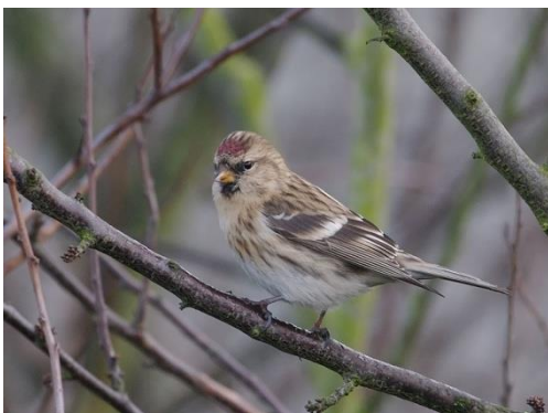
Kleine barmsijs (Birdshooting.nl)