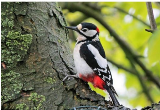
Grote bonte specht