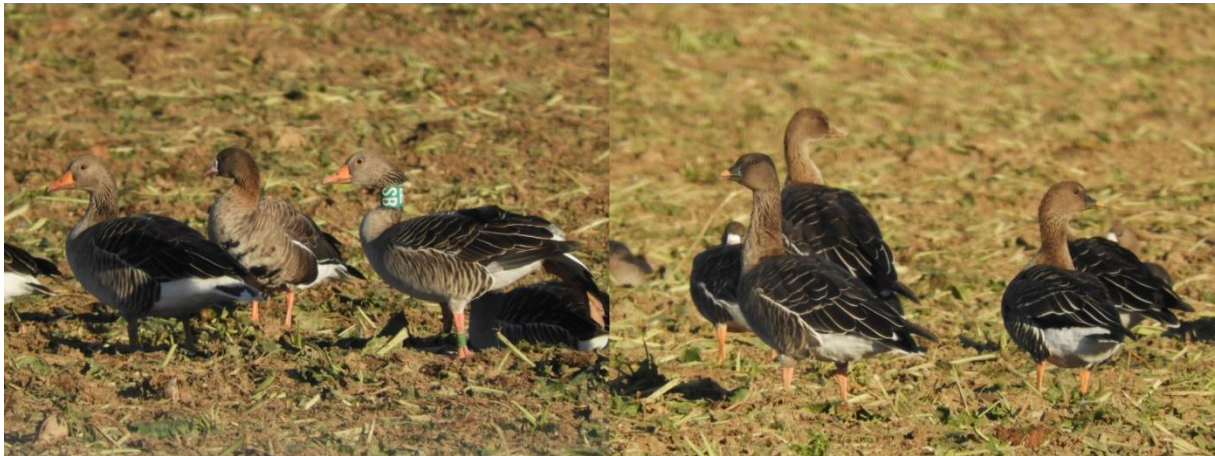
Grauwe gans, kolgans en toendrarietgans (Jeroen Verburg)

kilometers, maar ook hadden we een exemplaar uit het oosten van Duitsland, Litouwen en een Russisch eiland in de Barentszee.