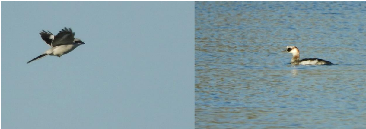
Klapexster en nonnetje (Jeroen Verburg)

Bij een oud gemaaltje werd een fraaie ijsvogel gezien en deze leidde ons naar een mooie plas waar diverse eenden en futen zwommen. We zagen hier een nonnetje, de eerste van het seizoen. Een prachtige eendensoort. Dit exemplaar leek een jong beest, nog niet volledig in prachtkleed. Twee roepende witgatjes gaven een mooie vliegshow weg en in de bosjes was een groep staartmezen druk aan het foerageren.