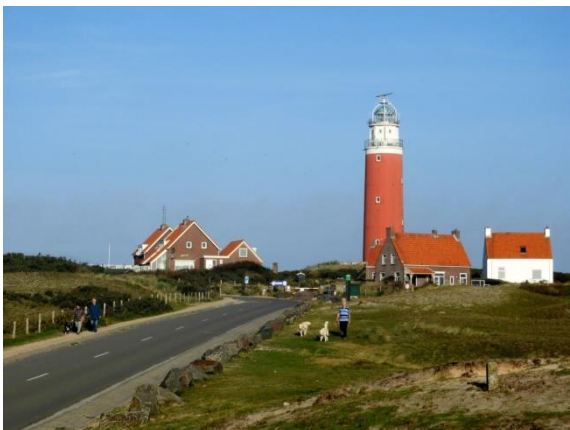
Vuurtoeren De Cocksdorp (Jeroen Verburg)

Na aankomst meteen linksaf richting De Petten en de Mokbaai. Het was laag water dus veel vogels in de Mokbaai met o.a. rosse grutto, zilverplevier, pijlstaart en brilduiker.