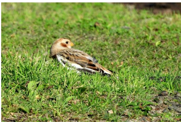
Sneeuwgor (Jeroen Verburg)

Na wat lopen werd door sommigen een eerste glimp opgevangen, maar hij bleef zich verplaatsen. Lastig beest .... tot hij even later blijkbaar een goede plek had gevonden om voedsel te vinden. Midden op het pad liet hij zich schitterend zien en regelmatig gooide hij met z'n lange snavel een prooi in de lucht om vervolgens met open bek op te vangen. Alle vogelaars tevreden!