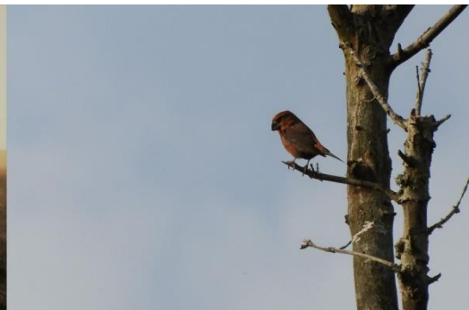
Grote kruisbek (Jeroen Verburg)

Ook nog maar even naar zee en bij de strandopgang was een mooie zwarte roodstaart aanwezig.