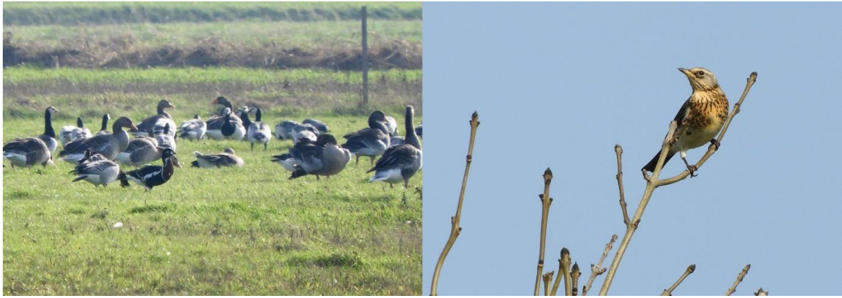
Roodhalsgans (Jeroen Verburg) Kramsvogel (Jeroen Verburg)