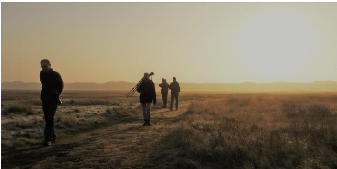
VWG in De Slufter (Jeroen Verburg)

De grote kruisbek moet toch een keer lukken hoor en na eerst even rondgevlogen te hebben, gingen 10 stuks in de kale bomen zitten. Geduld wordt dus toch beloond!