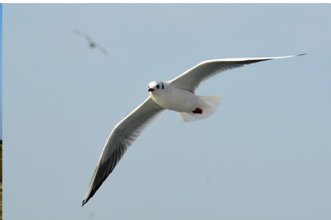
Kokmeeuw (Hans Takke)