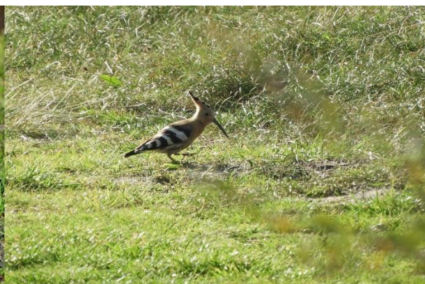
Hop (Jeroen Verburg)

Net voor het Texelweekend werd Nederland getraakteerd op een kleine invasie van grote kruisbekken vanuit het noorden. Ook op Texel was een groepje aanwezig in de Staatsbossen en dus moesten we deze ook proberen om op onze lijst te krijgen. De plek was niet moeilijk te vinden met vele vogelaars die op wacht stonden. Al bij aankomst zat een kruisbek in een hoge boom, maar onduidelijk of dit