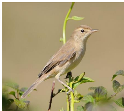
Kleine spotvogel

We reizen per busje(s) van oost naar west Letland en bezoeken de belangrijkste nationale parken van het land (Gauja, Lubans, Sliteres, Engures Ezers, Kemeris).